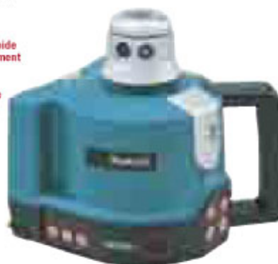
Utilisation en extérieur

Niveau laser facile et rapide à installer. Il est entièrement automatique en modes horizontal et vertical. Système électronique de mise à niveau renforcé.